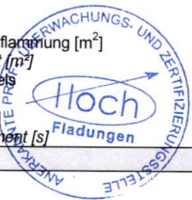
Tabelle / table 2: Prüfergebnisse der SBI Prüfungen / SBI test results